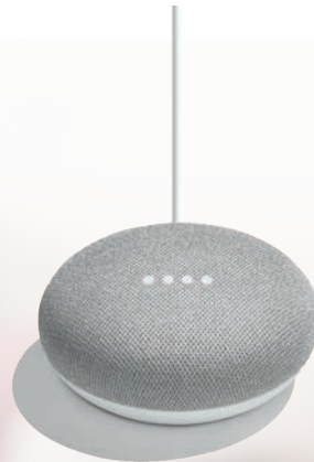
Google Home Mini